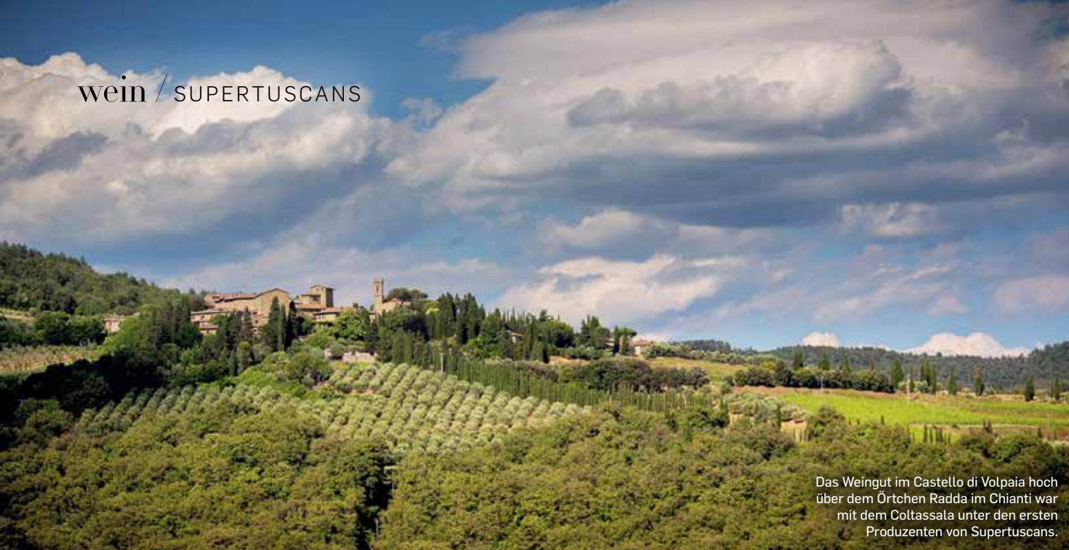
Das Weingut im Castello di Volpaia hoch über dem Örtchen Radda im Chianti war mit dem Coltassala unter den ersten Produzenten von Supertuscans.