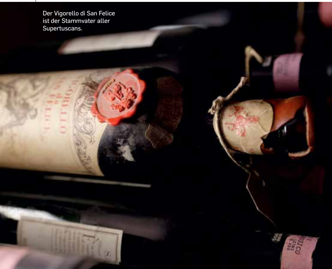
Der Vigorello di San Felice ist der Stammvater aller Supertuscans.