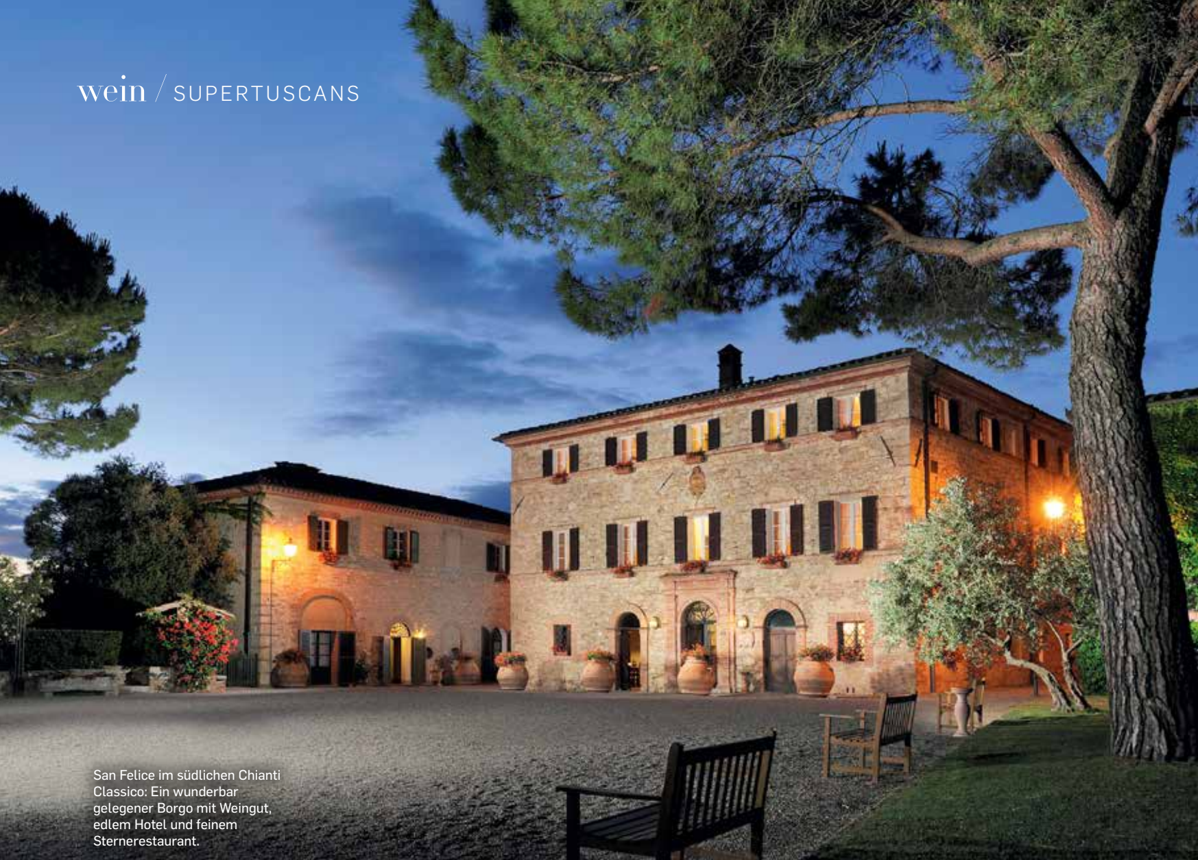
San Felice im südlichen Chianti Classico: Ein wunderbar gelegener Borgo mit Weingut, edlem Hotel und feinem Sternerestaurant.