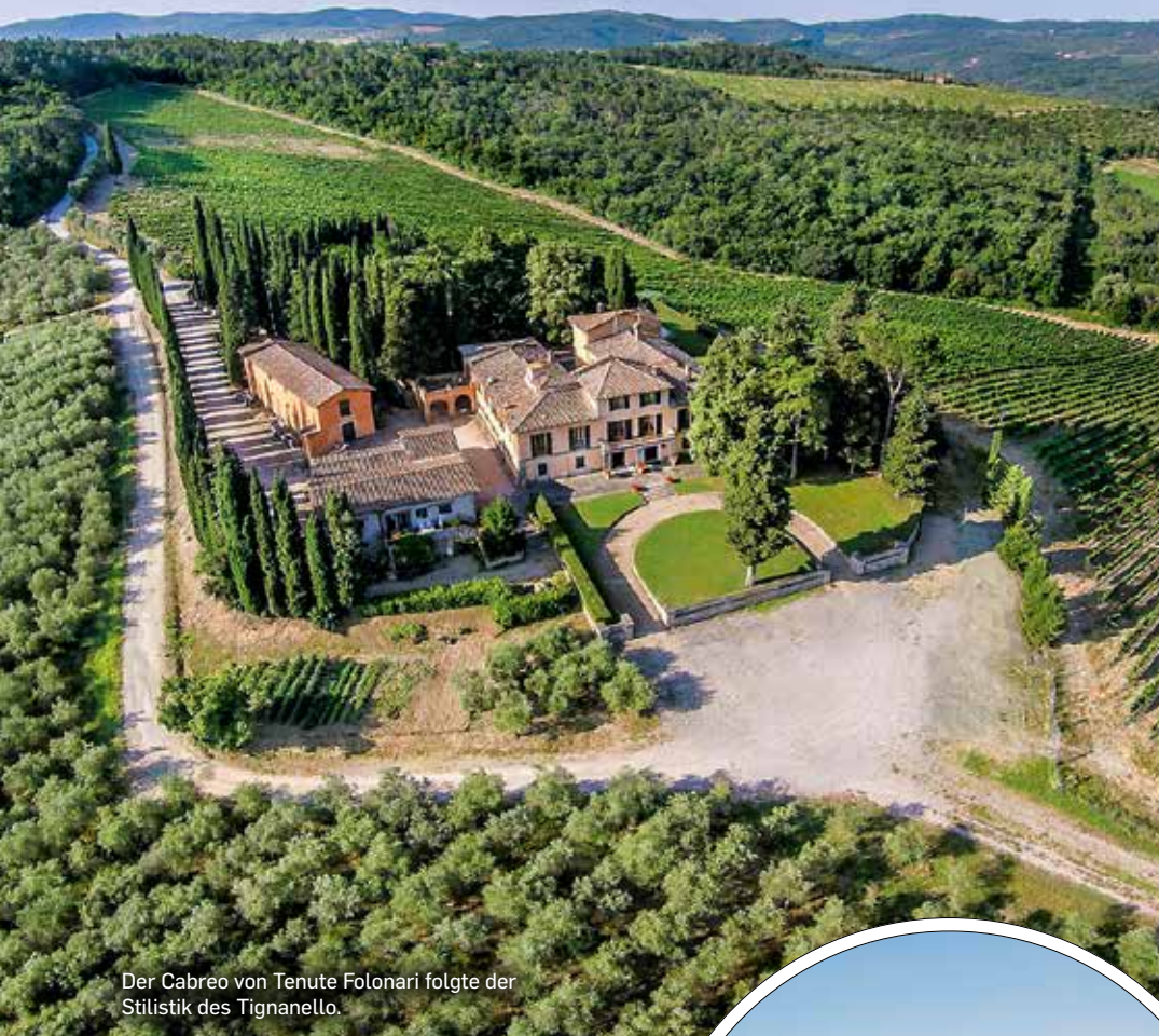
Der Cabreo von Tenute Folonari folgte der Stilistik des Tignanello.

> Mit der Novellierung des italienischen Weinrechts wurden diese »Vini da Tavola« ab 1995 als Toscana IGT klassifiziert. 1996 wurde es möglich, Chianti Classico DOCG allein aus Sangiovese zu erzeugen. Viele Supertuscans hätten ab dem Zeitpunkt auch als Chianti Classico deklariert werden können. Angesichts des Preisgefälles zwischen den besten Supertuscans und einem Chianti Classico war es für die meisten Hersteller aber ratsam, auch weiter Supertuscans zu erzeugen.